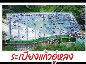
ระเบียงแก้วอุ้งหลง