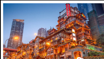
ตลาดแดงเซาตัง