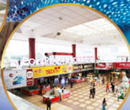
ตลาดกังเป๋ย