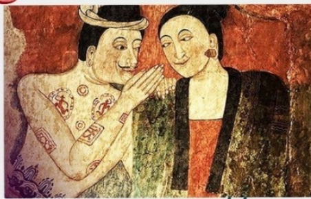
จิตรกรรมฝาผนังพม่า