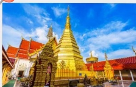
วัดพระธาตุช่อแฮ