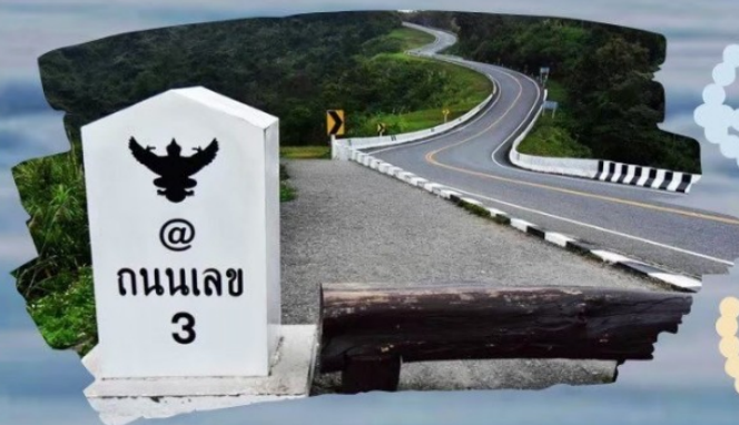
@ ถนนเลข 3