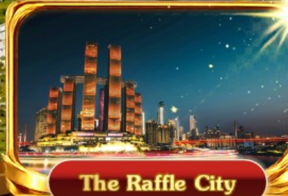
The Raffle City