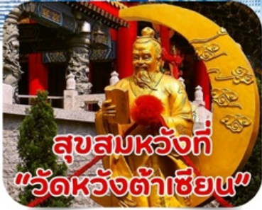
สุขสมหวังที่ "วัดหวังต้าเซียน"

*ราคาเริ่มต้นที่ 4,555.- บาท/ท่าน วันนี้-ธ.ค.67