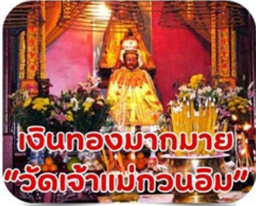
เงินทองมากมาย "วัดเจ้าแม่กวนอิม"