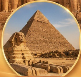
ปิรามิด & สฟิงซ์