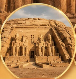
อาบู ซิมเบล