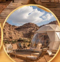
แคมป์กลางทะเลทราย