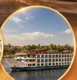
ล่องเรือแม่น้ำไนล์