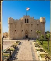
อเล็กซานเดีย