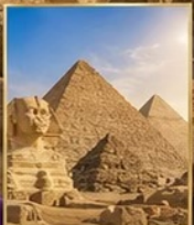
มหาพีระมิดกิซ่า