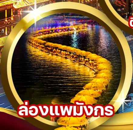
ล่องแพมังกร