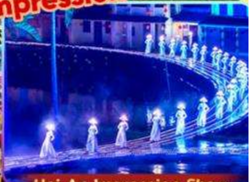
Hoi An Impression Show