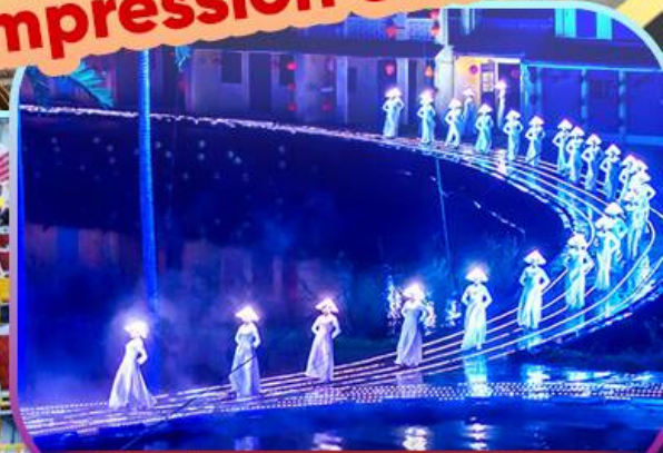
Hoi An Impression Show