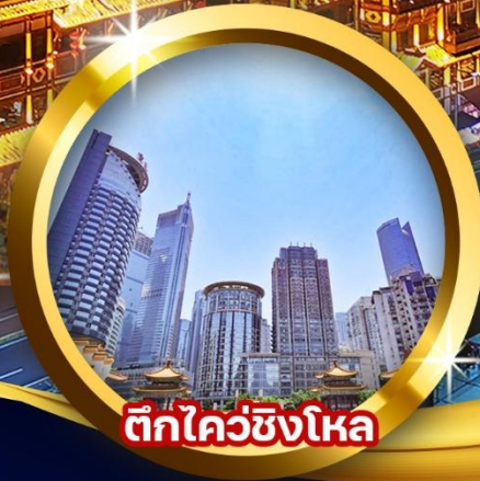
ตึกไคว่ซิงโหล