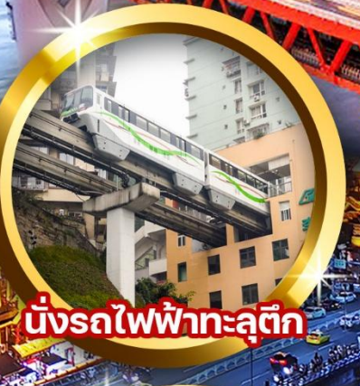
นั่งรถไฟฟ้าทะเลตุ๊ก