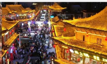
ตลาดกลางคืนจางเย่

*ทางบริษัทฯ ขอสงวนสิทธิ์ในการสลับโปรแกรมทัวร์ตามความเหมาะสมขึ้นอยู่กับสถานการณ์หน้างาน โดยคำนึงถึงผลประโยชน์ของลูกค้าเป็นสำคัญ