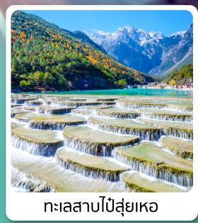
ทะเลสาบไป๋ส่วยเหอ