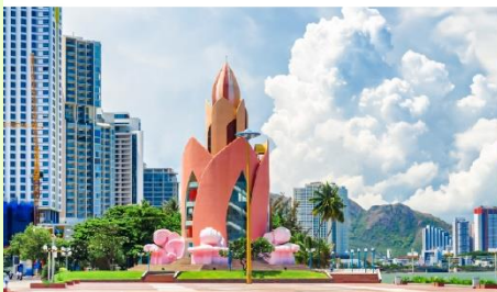
Tram Hung Tower