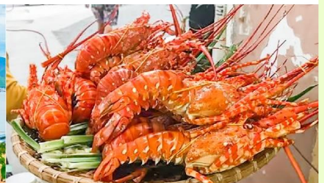
Nha Trang Night Market

*ทางบริษัทฯ ขอสงวนสิทธิ์ในการสลับโปรแกรมทัวร์ตามความเหมาะสมขึ้นอยู่กับสถานการณ์หน้างาน โดยคำนึงถึงผลประโยชน์ของลูกค้าเป็นสำคัญ