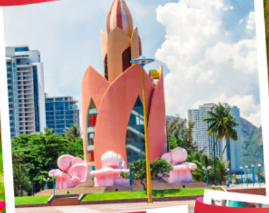
Nha Trang Cathedral