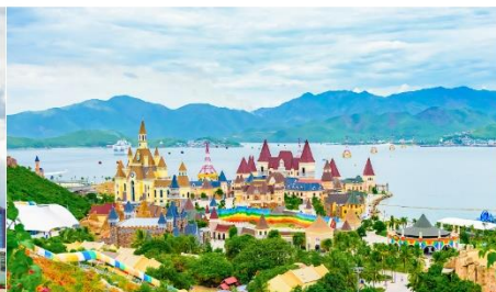
VinWonders NHA TRANG