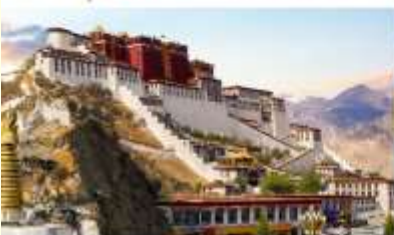
พระราชวังโปตาลา