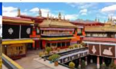
วัดโจคัง

*ทางบริษัทฯ ขอสงวนสิทธิ์ในการสลับโปรแกรมทัวร์ตามความเหมาะสมขึ้นอยู่กับสถานการณ์หน้างาน โดยคำนึงถึงผลประโยชน์ของลูกค้าเป็นสำคัญ