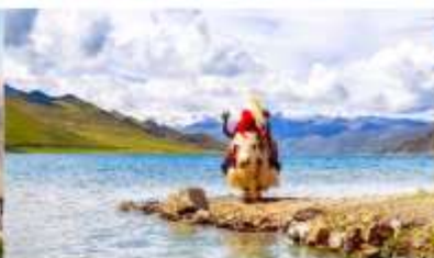
ทะเลสาบยัมดรก