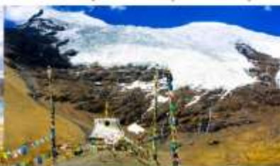
รารน้ำแข็งคาโนลา