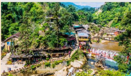
หมู่บ้าน Cat Cat