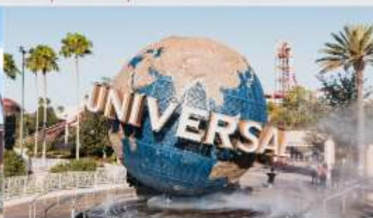
ยูนิเวอร์เซล ปักกิ่ง รีสอร์ท