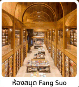
ห้องสมุด Fang Suo