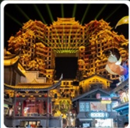
ตึกหัตถจารย์ 72