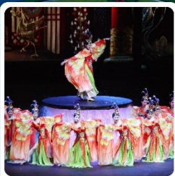
โชว์ FOSHAN QIANGQING