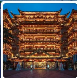
วัดต้าฟ้อซื่อ