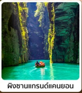
ผิงซานแกรนด์แคนยอน

ไฮไลท์! บินตรงลงเอินซือ เกียวเอินซือเน้นๆจัดเต็มทั่วเมือง คุบเขาสิงโต ผิงซานแกรนด์แคนยอน อุทยานจันลี่ซาน