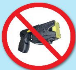
ปืนซ็อตไฟฟ้า