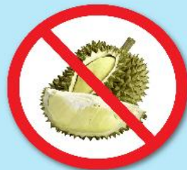
ผลไม้เขตร้อน ที่มีหนาม