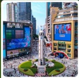
ถนนเจียฟางเป่ย์