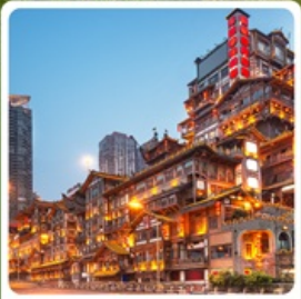
หงหยาดต้ง