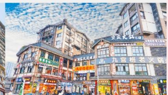
หมู่บ้านโบราณฉือชิว

*ทางบริษัทฯ ขอสงวนสิทธิ์ในการสลับโปรแกรมทัวร์ตามความเหมาะสมขึ้นอยู่กับสถานการณ์หน้างาน โดยคำนึงถึงผลประโยชน์ของลูกค้าเป็นสำคัญ