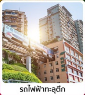
รถไฟฟ้าทะเลติก