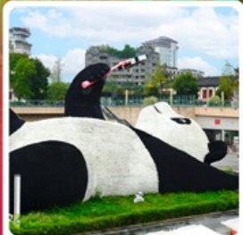
รูปปั้นหมีแพนด้าอนุเชลฟ์