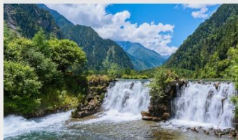
อุทยานแห่งชาติปี่เฟิงโกว