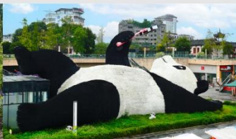
รูปปั้นหมีแพนด้าอนเซลฟี