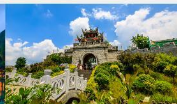
เมืองโบราณซิงเหยียน

*ทางบริษัทฯ ขอสงวนสิทธิ์ในการสลับโปรแกรมทัวร์ตามความเหมาะสมขึ้นอยู่กับสถานการณ์หน้างาน โดยคำนึงถึงผลประโยชน์ของลูกค้าเป็นสำคัญ