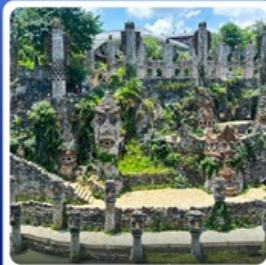
ปราสาทหินเย่หลางกู่