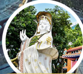
เจ้าแม่กวนอิม รัฟลส์ เบย์