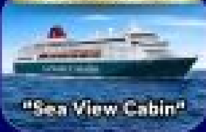
"Sea View Cabin"