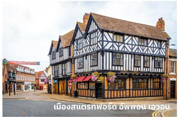
เมืองสแตรทฟอร์ด อัพพอน เอวอน

จากนั้นนำท่านเดินทางสู่ เขตคอสโวลส์ เขตหมู่บ้านชนบทแสนสวยของอังกฤษถึง 70 หมู่บ้าน ใช้เวลาเดินทางประมาณ 1 ชั่วโมง นำท่านเที่ยวชม หมู่บ้านเบอร์ตันออนเดอะวอเตอร์ (Bourton On The Water) หมู่บ้านเล็ก ๆ ที่รู้จักกันในนามของ “เวนิส แห่งคอตวอลส์” เมืองที่โด่งดังที่สุดในคอตวอลส์ ดูเจียบสงบมีลำธารสายเล็ก ๆ (แม่น้ำวินด์ริช) ไหลผ่านกลางเมือง และมีสะพานหินทอดข้ามน้ำเป็นช่วง ๆ กับต้นวิลโลว์ที่แกว่งกิ่งก้านใบอยู่ริมน้ำ