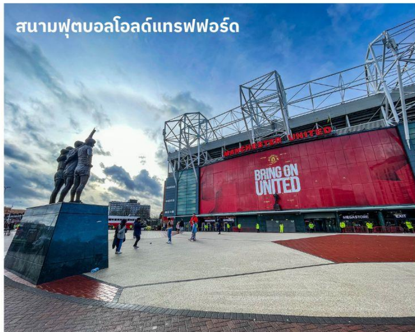
สนามฟุตบอลโอลด์แทรฟฟอร์ด

จากนั้นนำท่านเดินทางสู่ เมืองแมนเชสเตอร์ ใช้เวลาเดินทางประมาณ 1 ชั่วโมง เป็นอีกหนึ่งเมืองท่าที่สำคัญของประเทศอังกฤษและยังเป็นเมืองที่มีประชากรมากที่สุดเป็นอันดับสองของประเทศอังกฤษ รองจากมหานครลอนดอน จากนั้นนำท่านถ่ายรูปด้านหน้า สนามฟุตบอลโอลด์แทรฟฟอร์ด แห่งทีมแมนเชสเตอร์ ยูไนเต็ด สโมสรฟุตบอลชื่อดังโลกที่มีสมาชิกแฟนคลับมากที่สุดในโลก เจ้าของสมญานาม “ปีศาจแดง” สนามเริ่มก่อสร้างในปี 1909 และเริ่มใช้ตั้งแต่ปี 1910 ปัจจุบันมีความจุ 76,212 คน