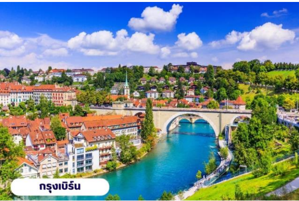
กรุงเบิร์น

📍 บริการอาหารเช้า ณ ห้องอาหารของโรงแรม จากนั้นนำท่านเที่ยวชมสถานที่สำคัญต่างๆในกรุงเบิร์น กรุงเบิร์นได้รับการยกย่องจากองค์การยูเนสโกให้เป็นเมืองมรดกโลก ในปี ค.ศ. 1863 นอกจากนี้เบิร์น ยังถูกจัดอันดับอยู่ใน 1 ใน 10 ของเมืองที่มีคุณภาพชีวิตที่ดีที่สุดในโลกในปี ค.ศ. 2010 นำท่านชม บ่อหมีสีน้ำตาล สัตว์ที่เป็นสัญลักษณ์ของกรุงเบิร์น นำท่านชม มาร์กาสเซ ย่านเมืองเก่า ปัจจุบันเต็มไปด้วยร้านดอกไม้และบูติก เป็นย่านที่ปลอดภัย จึงเหมาะกับการเดินเที่ยวชมอาคารเก่า อายุ 200-300 ปี นำท่านลัดเลาะชม ถนนจุงเคอร์นกาสเซ ถนนที่มีระดับสูงสุดของเมืองนี้ ซึ่งเต็มไปด้วยร้านภาพวาดและร้านขายของเก่าในอาคารโบราณ ชม นาฬิกาใช้ทศลือคเคนทรม อายุ 800 ปี ที่มีโชว์ให้ดูทุกๆชั่วโมงในการตีบอกเวลาแต่ละครั้ง หอนาฬิกานี้ ในช่วงปี ค.ศ. 1191-1256 ใช้เป็นประตูเมืองแห่งแรก ภายหลังได้ดัดแปลงใช้ทศลือคเคนทรมให้กลายเป็นหอนาฬิกา พร้อมติดตั้งนาฬิกาดาราศาสตร์เข้าไป จากนั้นอิสระให้ท่านเดินเล่นและเก็บภาพตามอัยาศัยหรือจะเลือกช้อปปิ้งซื้อสินค้าแบรนด์เนมและซื้อของที่ระลึก