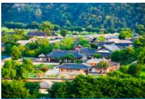
ศูนย์วัฒนธรรมเกาหลี

เช้า รับประทานอาหารเช้า ณ ห้องอาหารของโรงแรม (6)