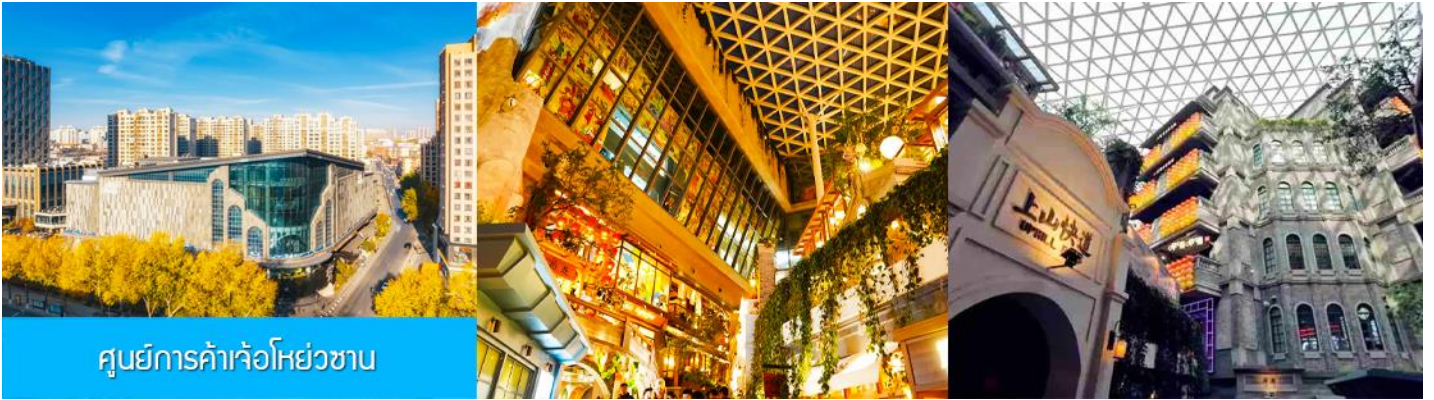
ศูนย์การค้าเจ้อหย่วซาน

นำท่านเที่ยวชม ศูนย์การค้าเจ้อหย่วซาน 这有山 แหล่งช้อปปิ้งจีนชื่อดังที่ผสมผสานระหว่างสถานที่ท่องเที่ยวและแหล่งรวมร้านค้า และร้านแนวฟาสต์ฟู้ด อาหารพื้นเมืองร่วมสมัย ภายใต้คอนเซ็ปต์ แหล่งช้อปปิ้งบนภูเขา และบนภูเขามีแหล่งช้อปปิ้ง เป็นจุดเช็คอินยอดนิยมที่เปิดให้คนพื้นที่และนักท่องเที่ยวเข้าชมตั้งแต่ปี ค.ศ. 2019