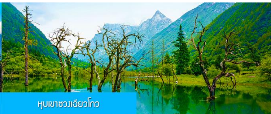
หุบเขาชวงเฉียวโกว