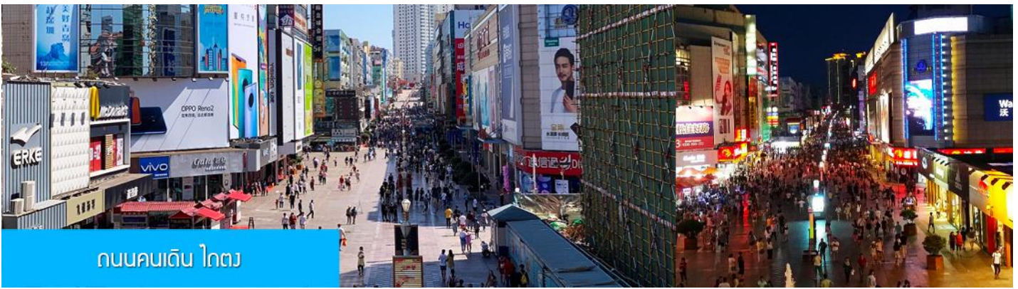
ถนนคนเดิน ไตตง

จากนั้นนำท่าน สู่ ถนนคนเดิน ไตตง 台东步行街 ย่านการค้าเป็นถนนคนเดินที่ใหญ่และคึกคักของเมืองชิงเต่า ที่นี้เป็นแหล่งรวมร้านค้าสินค้าแฟชั่นร่วมสมัย สินค้าพื้นเมือง ของที่ระลึก และร้านอาหาร บาร์เบียร์ของเมืองชิงเต่ามากมาย, ให้ท่านมีเวลาอิสระเดินเล่น ช้อปปิ้ง ลิ้มรสอาหารพื้นเมือง และเลือกซื้อของฝาก ตามอัธยาศัย