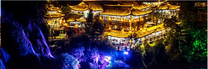
เมืองโบราณฟู่หรงเจิน

วันที่สาม เมืองหยีซัง – เมืองจางเจียเจี๋ย – ตึกมหัศจรรย์ 72 ชั้น-ศูนย์แพทย์แผนจีน – เมืองโบราณฟู่หรงเจิน