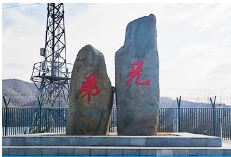
ป้ายพรมแดนจีนเกาหลีและแท่งศิลาสองพี่น้อง