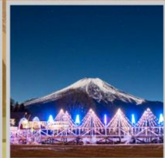
"YAMANAKAKO ILLUMINATION FANTASEUM"