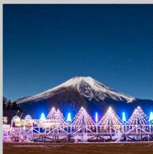
“YAMANAKAKO ILLUMINATION FANTASEUM”