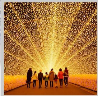
“NABANA NO SATO”