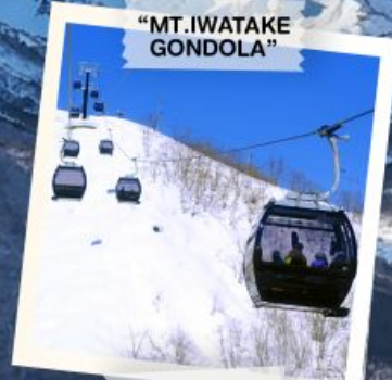
"MT. IWATAKE GONDOLA"