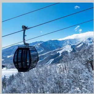
“HAKUBA IWATAKE GONDOLA”