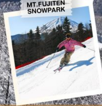
MT. FUJITEN SNOWPARK

วันเดินทาง 30 ธ.ค. - 5 ม.ค. 2570 (วันขึ้นปีใหม่)