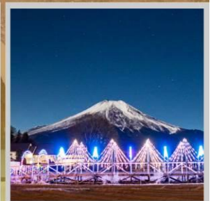
"YAMANAKAKO ILLUMINATION FANTASEUM"