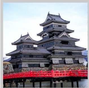
“MATSUMOTO CASTLE PARK”

สัมผัสความงดงามด้านนอก “ปราสาทมัตสึโมโตะ” ที่ตั้งตระหง่านท่ามกลางฉากหลังของเทือกเขาแอลป์ตอนเหนือ เปลี่ยนอิริยาบถ “ส่องเรือชมหุบเขาอะนะเคียว” ชมความงดงามธรรมชาติ ต้นไม้ หน้าผา และสะพานแดงอันโด่งดัง ตื่นตากับการประดับไฟกว่า 5 แสนดวง กับงาน “YAMANAKAKO ILLUMINATION FANTASEUM” ริมทะเลสาบยามานากะ สนุกสนานกับการเล่นหิมะ ในกิจกรรมต่างๆ ณ “FUJITEN SNOW PARK” พร้อมวิวภูเขาไฟฟูจิเป็นฉากหลัง ตระการตา “เทศกาลประดับไฟฤดูหนาว” ในธีมต่างๆหลากหลายโซน จัดแสดงไฟกว่า 2 ล้านดวงที่ยิ่งใหญ่ติดอันดับ1 ของญี่ปุ่น เปลี่ยนอิริยาบถ “นั่งกระเช้าฮาคุบะ อิวะตะกะะ” เพื่อชมวิวเทือกเขาแอลป์ญี่ปุ่นกับทิวทัศน์ฤดูหนาวแบบพาโนรามา