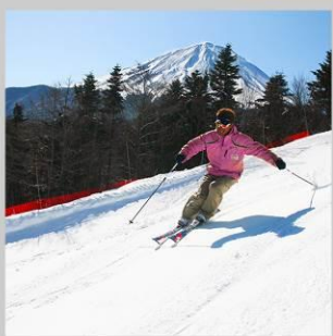
“FUJITEN SNOW PARK”