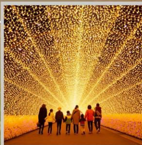
"NABANA NO SATO"