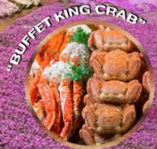
"BUFFET KING CRAB"