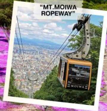
"MT. MOIWA ROPEWAY"

OBIHIRO / FURANO / BIEI / SOUNKYO / KITAMI / MOMBETSU / TAKINOUE / KAMIKAWA / SAPPORO / OTARU / PINKMOSS