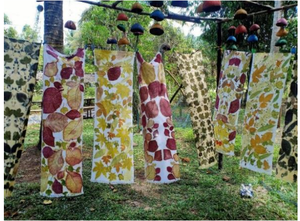
จากนั้น แวะชมศูนย์หัตถกรรมกลุ่มกะลามะพร้าว ผลิตภัณฑ์จากกะลามะพร้าว