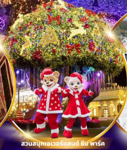
สวนสนุกเอเวอร์แลนด์ ฮิม พาร์ค