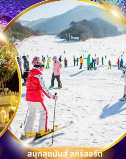
สกีรีสอร์ท

ชมจอ LED ขนาดยักษ์ที่รีสอร์ท 5 ดาว ใหญ่ที่สุดในเอเชียเหนือ สัมพัสมะสกีรีสอร์ท สกีรีสอร์ท สวนสนุกเอเวอร์แลนด์ ชมพระราชวังคยองบกคุง ย้อนอดีตหมู่บ้านบุกซอน ฮันอก อิสระช้อปปิ้งคังนัม Lotte Duty Free