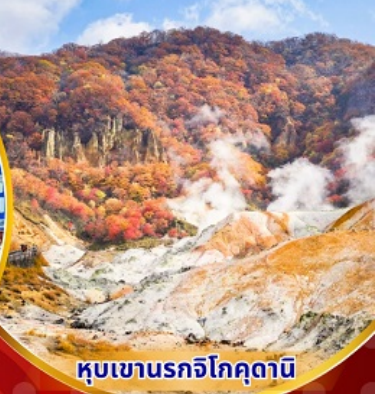
หุบเขานรกจิโกลุคดาบิ