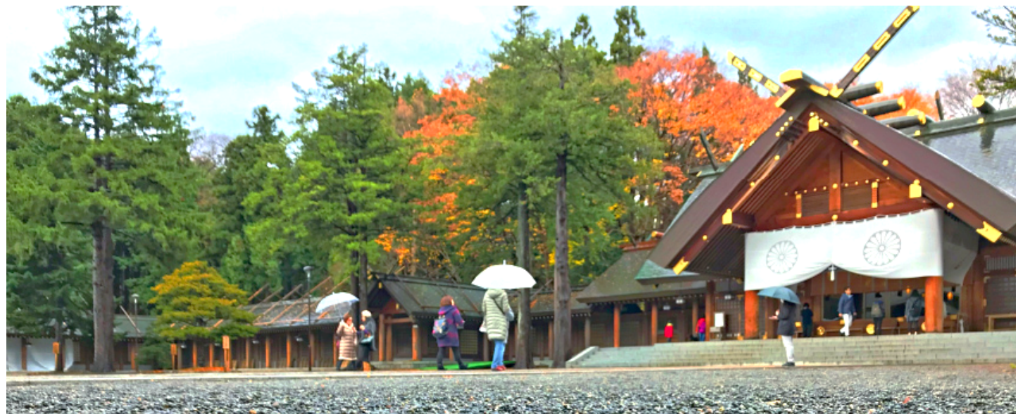
อาหารกลางวัน (7)

ศาลเจ้าฮอกไกโด (Hokkaido Shrine) เป็นศาลเจ้าของศาสนาพุทธนิกายชินโตที่มีความเก่าแก่ของเกาะฮอกไกโด ที่ศาลเจ้าแห่งนี้ถูกสร้างขึ้นในช่วงยุคเริ่มพัฒนาเกาะถ้าจะนับเป็นปีก็ประมาณปี ค.ศ.1871 ไม่เพียงแต่การมาสักการะขอพรกับเทพเจ้าที่ประทับภายในศาลเจ้ามากถึง 4 องค์ แต่ด้วยความที่ตัวศาลเจ้าเองมีพื้นที่เชื่อมต่อกับสวนมารุยามะทำให้ถือได้ว่าเป็นจุดชมวิวยุคใหม่ที่สวยอีกแห่งหนึ่งของเมือง