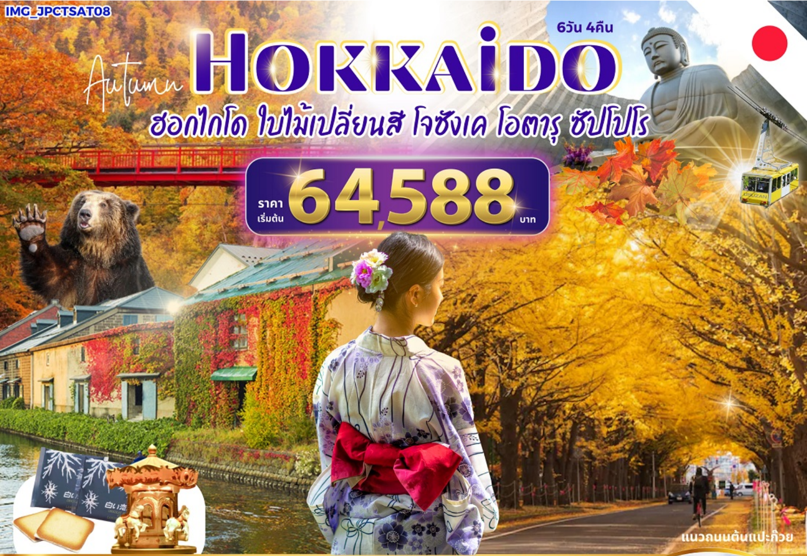
แนวถนนต้นแปะก๊วย

สัมผัสใบไม้เปลี่ยนสีโรแมนติกที่ฮอกไกโด ชมความน่ารักของหมีภูเขาไฟ ขึ้นกระเช้าภูเขาไฟซุซุ พลาดไม้ไผ่ เซคอินคยองโอตารุ นาฬิกาไอน้ำ พิพิธภัณฑสถานแห่งชาติ โรงงานช็อกโกแลต สักการะศาลเจ้าฮอกไกโด สะพานแขวนฟุตะมิ มิตซุยเอ้าท์เลทซัปโปโร