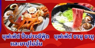
บุฟเฟ่ต์ บิงย่างซีฟู้ด และชาบูไม่อื่น บุฟเฟ่ต์ ชาบู ชาบู

THAI บริการอาหารร้อน นน.กระบี่ 23 กก. สายการบินไทย เอนเตอร์เทนเมนท์ฟรี