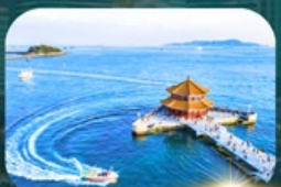
สะพานฉานเฉียว

พักโรงแรม 4 ดาว ★★★★★ ฟรี ประกันอุบัติเหตุ บริการอาหารท้องถิ่น