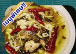
ปลาต้มพริกภาคตอง