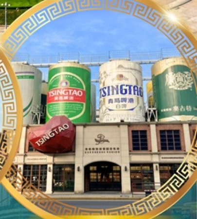
โรงงานเบียร์ชังเต่า