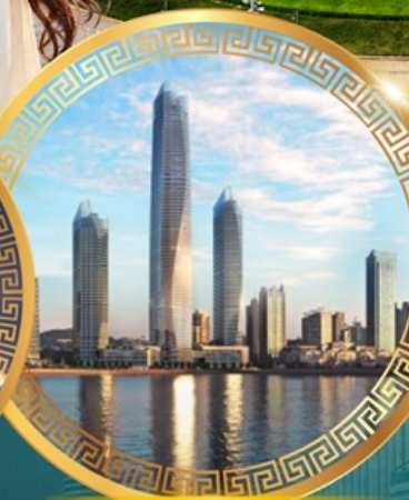
ชมวิวดาคารโซตัน เซ็นเตอร์