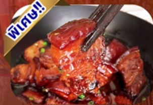
เมนูหมูสามชั้นตุ๋นน้ำแดง

พักโรงแรม 4 ดาว ★★★★★ ฟรี ประกันอุบัติเหตุ บริการ อาหารท้องถิ่น