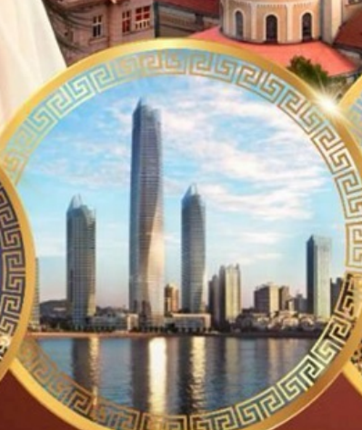
ชมวิวดาคารโฮตัน เซ็นเตอร์