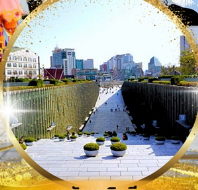
มหาลัยหญิงอีวา