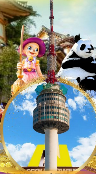
N Seoul Tower