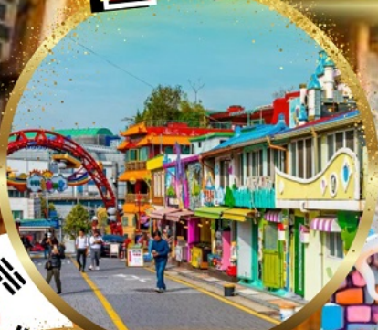
หมู่บ้านเทพนิยาย