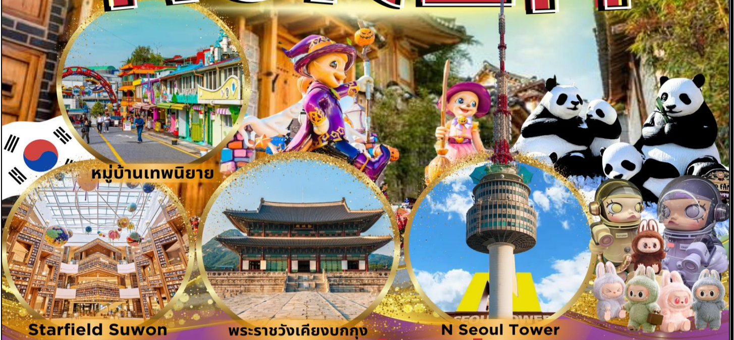
หมู่บ้านเทพนิยาย