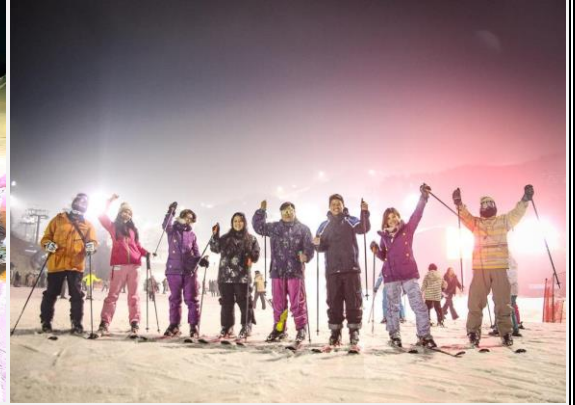
กางเกงที่เหมาะสม) ทุกท่านสามารถเล่นได้ไม่จำกัดเวลา