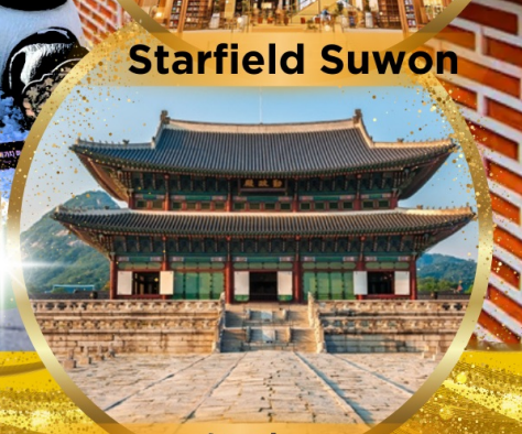
พระราชวังเคียงบกกุง

EASTAR JET / t'way 이스타항공 เดินทาง ต.ค. - พ.ย. 67 น้ำหนัก 20 Kg. Carry on 10 Kg.