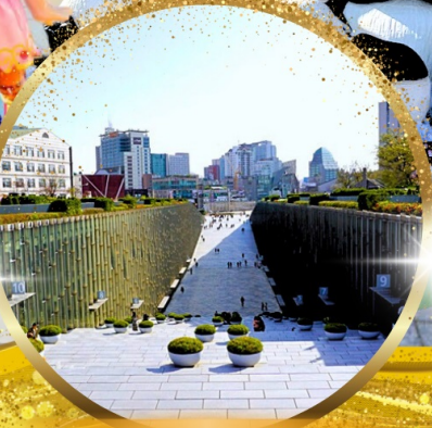
มหาลัยหญิงอีวา